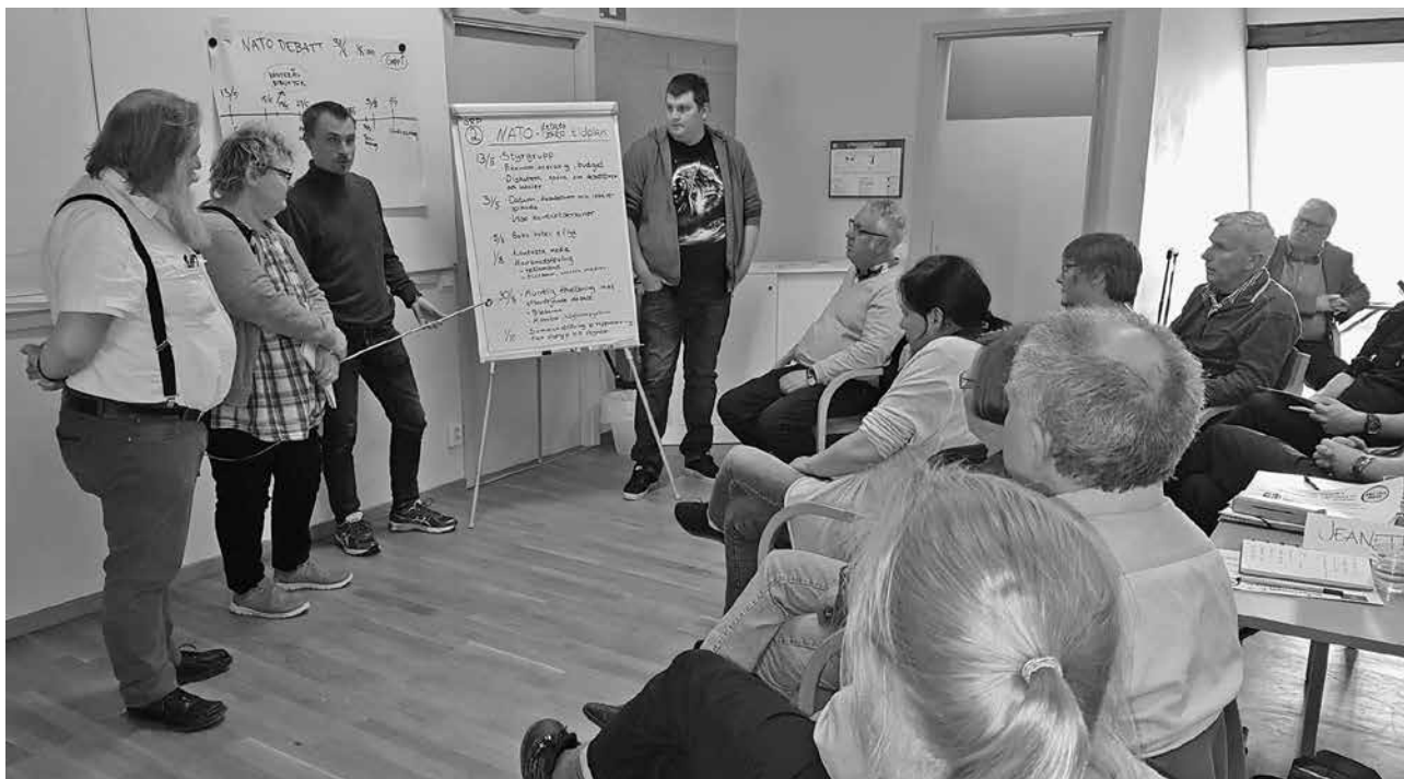
Hur planlägga och genomföra ett event – gruppredovisning vid grundkurs i Totalförsvarsinformation.

Sheila Höglund: att se till att FPFÖ syns, jag hoppas kunna bidra med spännande föredragningar.