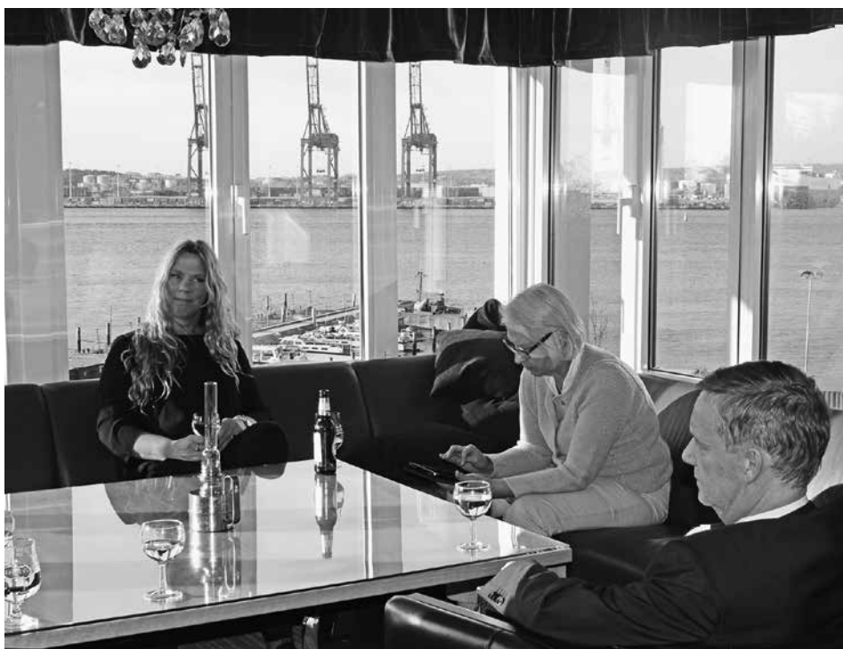
Till höger: En stunds avkoppling i god samvaro innan en förträfflig middag.