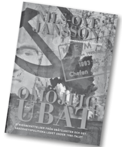
Söndagen bjöd på ett mycket intressant föredrag av Nils- Ove Jansson om de ubåts- kränkningar som varit/är mot Sverige.