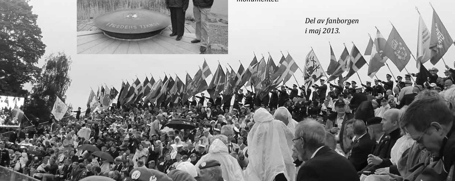
Del av fanborgens i maj 2013.