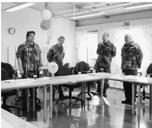
Till vänster: Att fylla jämnt på en kurs kan vara ett äventyr. Här firas en 40-åring med ballonger.