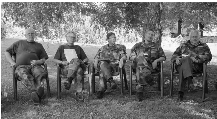
Ovan: Backspegeln är ett sätt att följa upp vad som varit dagen innan samt möjlighet att följa eventuella oklarheter.