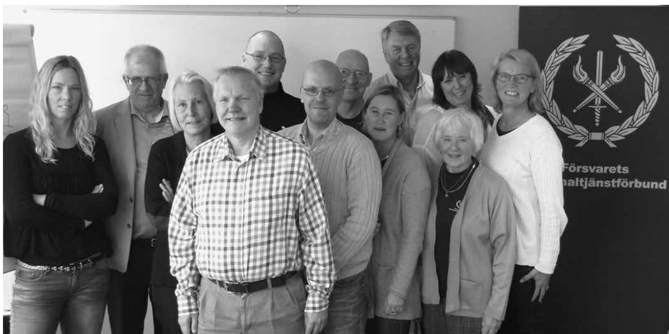
Första gruppen samlad bredvid FPF:s nya rollup.