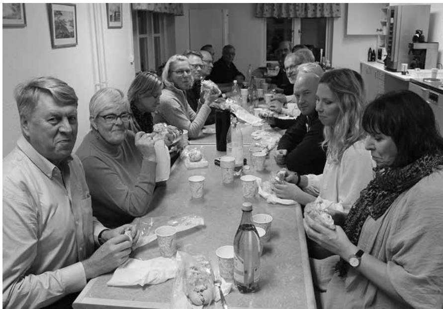
Till höger: Råkbaguette, mums va gott!