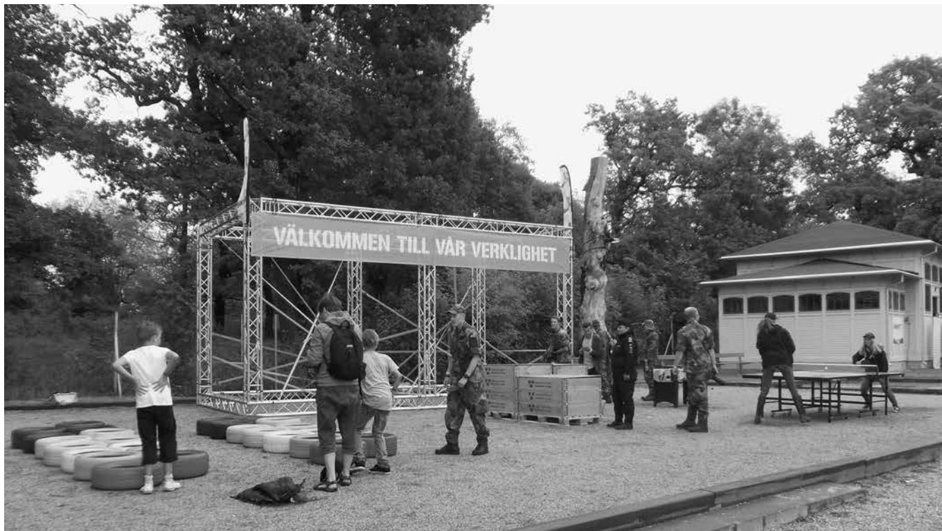
Försvarets monter var mycket välbesökt. Både försvarsministern och justitieministern tog sig tid att gå dit och prata med de medverkande i monter.