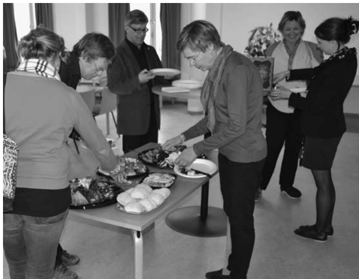
Buffé är alltid både gott och trevligt.