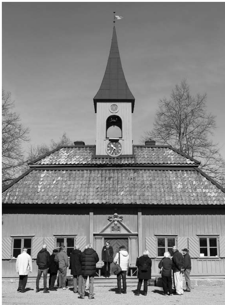
Sigtuna lilla Rådhus.