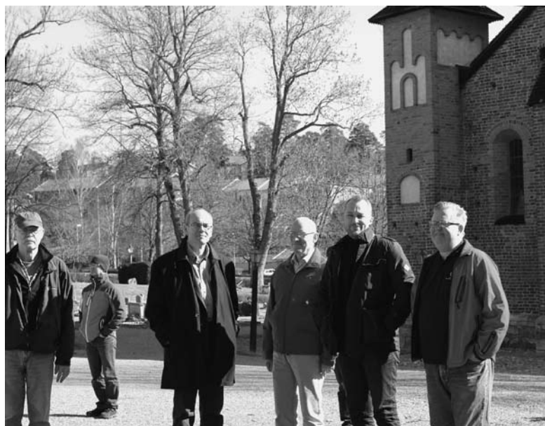
Samling utanför Mariakyrkan innan vi gick på en guidad tur i Sigtuna.

Nu ska det bli gott med kaffe och hembakad kanelbulle.