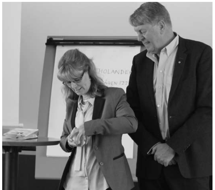
Lite knivigt att öppna men skam den som ger sig. Innehållet varörhängen som symboliserade gemenskapen i FPF.

Försvarmakten har hundar i flera sammanhang och hundras är schäfer en ras som visat sig bäst passa in på de krav som Försvarmakten ställer. En dressör utbildar hunden och en instruktör utbildar hund och soldat tillsammans.