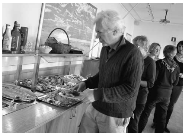
En läcker buffé väntade.