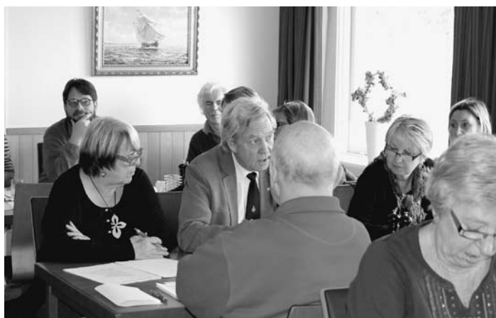
Deltagare i stämman.