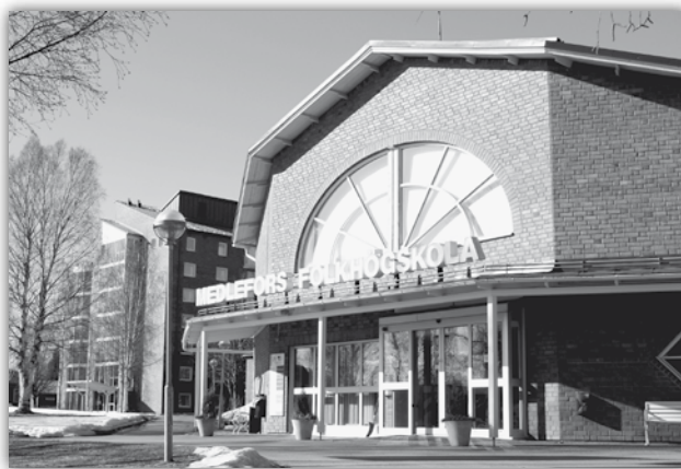
Stämman hölls på Medlefors folkhögskola i Skellefteå.