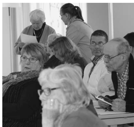
Norras deltagare i litet småsnack.