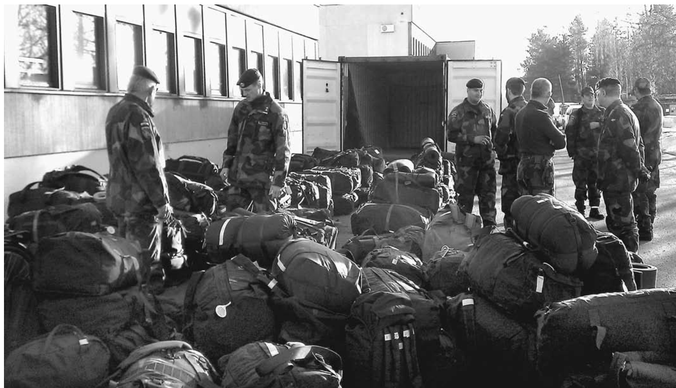
All packning med personlig utrustning som ska in i containern före avfärd mot Kosovo.

Några utflykter har jag även hunnit med såsom till Sophia i Bulgarien, en 72-timmars resa med MWA (en welfarebyrå för de som hade långa missionstider och svårt att få möjlighet att komma hem), och även ett flertal