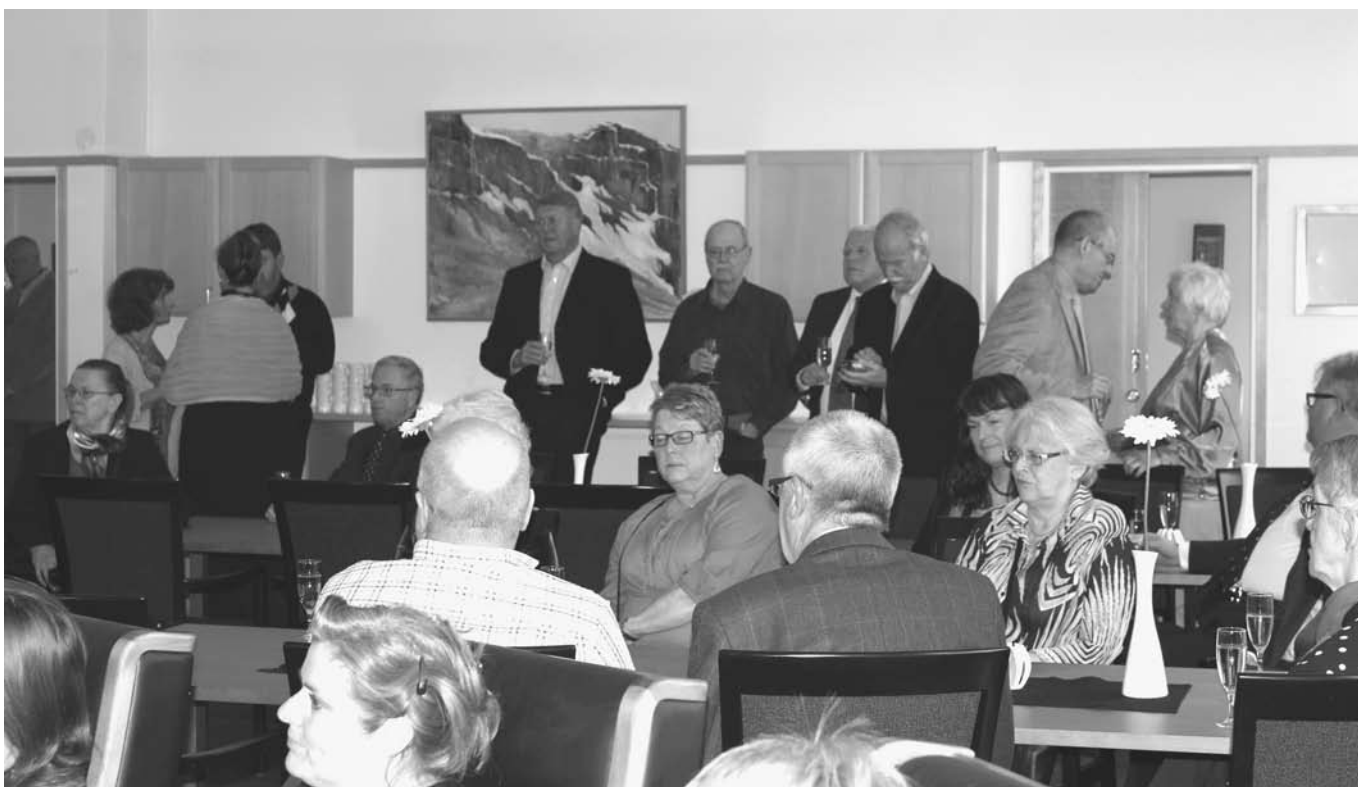
Innan middagen bjöds på ett glas "bubbel" för att fira 60-åringen.