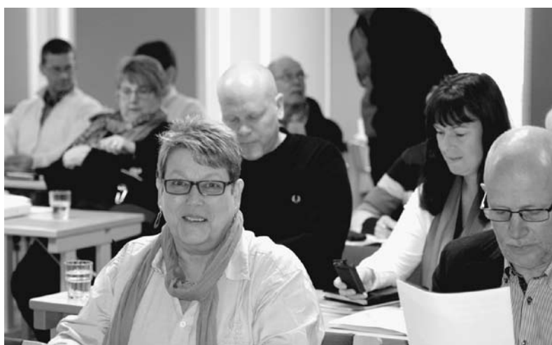
Östras ombud och deltagare samlade inför den stundande stämman.