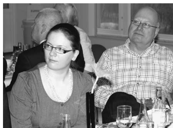
Förbundets sekreterare och nyvalde ordförande lyssnar på tal samt njuter av jubileumsmiddagen.